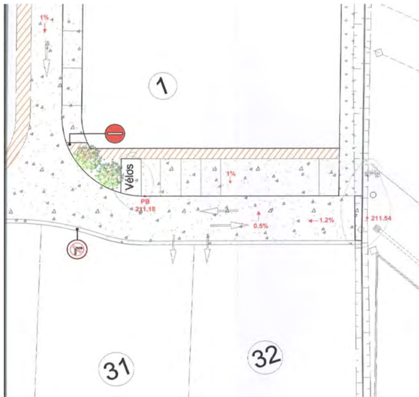
Plan de composition du Permis d'Aménager de Promologis